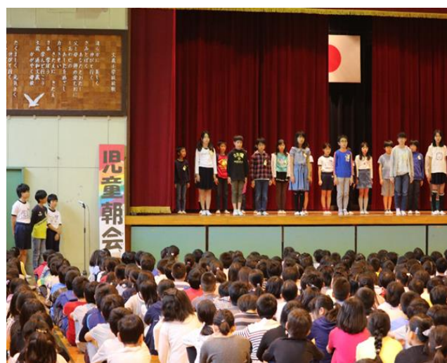
[4月24日(火) 児童朝会の様子]

さて、文蔵小学校では、さいたま市学校教育ビジョンで掲げる子ども像「ゆめをもち、未来を切り拓く、さいたま市の子ども」を受け、今年度も確かな学力、豊かな心、健やかでたくましい体の調和のとれた児童の育成を目指してまいります。そのためには、学習と生活の基礎的・基本的な事項の確実な定着を図り、子ども一人ひとりの「良さ」を見つけ、伸ばす教育を実践することが不可欠です。授業の質を高め、子どもや保護者の皆様の心に寄り添う教育を実践し、地域に根ざした信頼される学校づくりを推進してまいります。